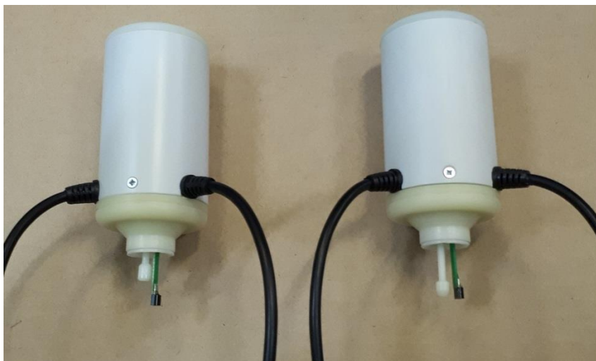
Рисунок 3 - Датчик застывания нефтепродуктов

4.3.5.4 Пробирка с Датчиком, находящимся в исходном состоянии, устанавливается в криостат прибора. Поднятый вверх груз перекрывает световой поток между светодиодами, расположенными в корпусе Датчика. Опускание груза на поверхность пробы происходит по команде от процессора прибора при достижении заданной температуры охлаждения. Если проба застыла, то световой поток перекрыт. По мере нагревания пробы начинается подвижка груза, световой поток открывается. Сигнал от приемного светодиода поступает на входной усилитель электронного блока управления. Температура, при которой сигнал с Датчика максимален, считается температурой застывания исследуемого образца.