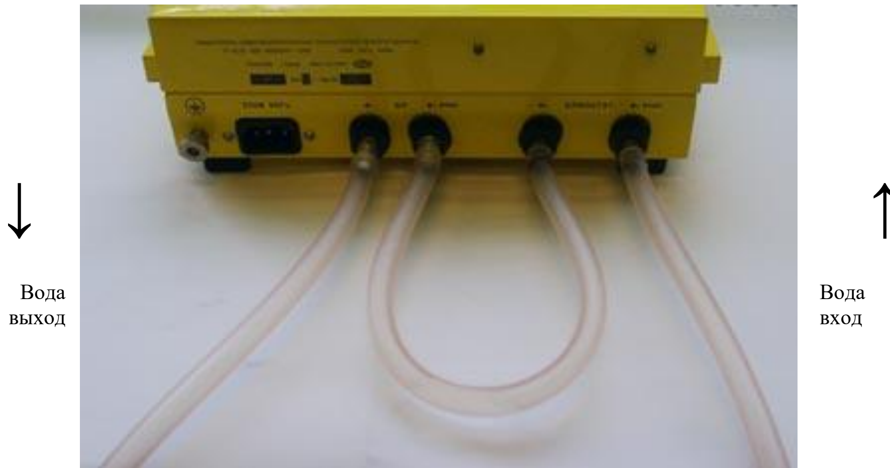
Вид прибора сзади