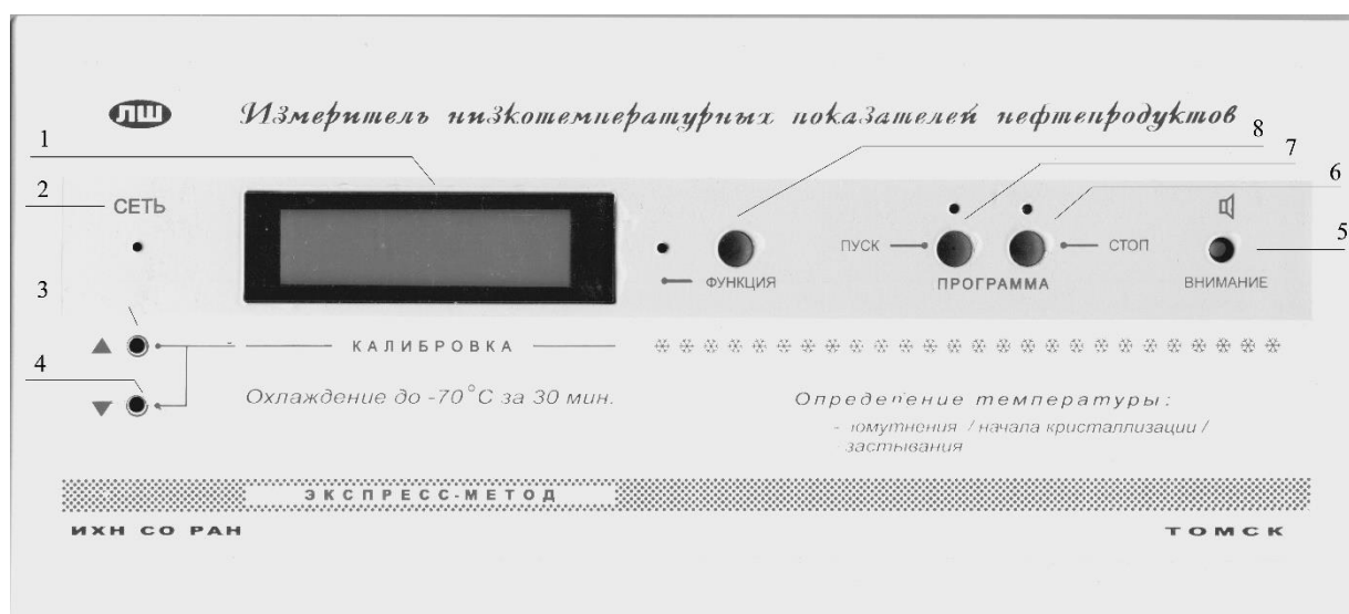
Рисунок 1 - Лицевая панель прибора

Электропитание прибора осуществляется от сети 220 В.